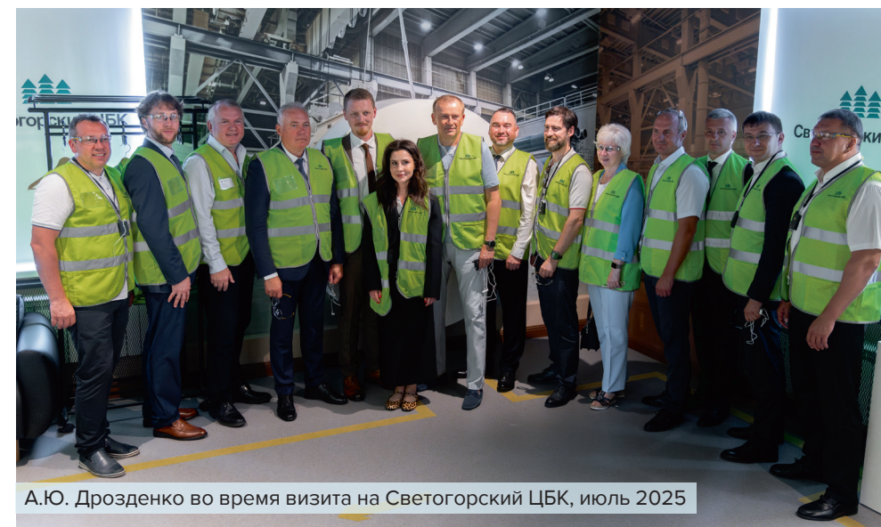
А.Ю. Дрозденко во время визита на Светогорский ЦБК, июль 2025

Также начато тесное сотрудничество по вопросам потребления БХТММ с фабриками, которые являются далеко не новичками в отрасли производства тишью. Здесь успешность внедрения БХТММ зависела от исходной конфигурации производственных